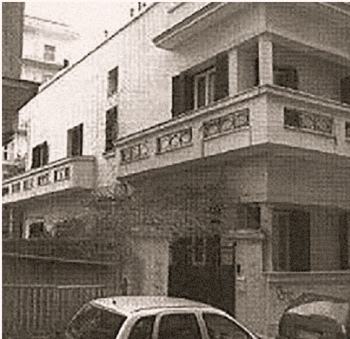
Η βίλα των SS στην οδό Βελισσαρίου, 2006. Το γραφείο του Brunner βρισκόταν στο ισόγειο στα δεξιά της εισόδου.