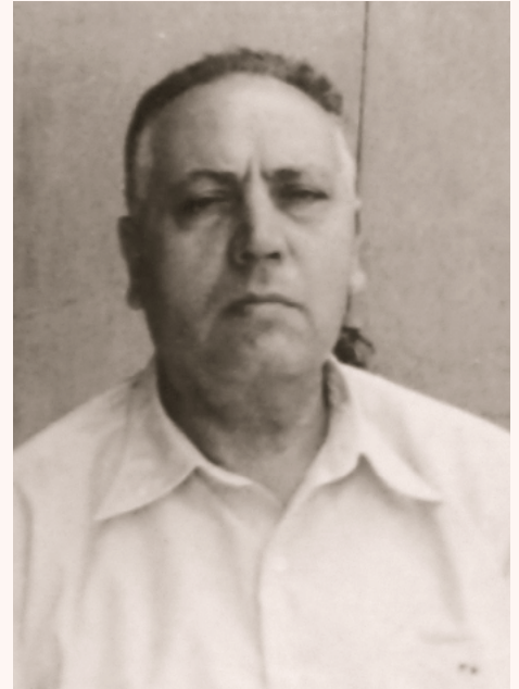
Ο Μάρκος Ασσάελ μετά τον πόλεμο